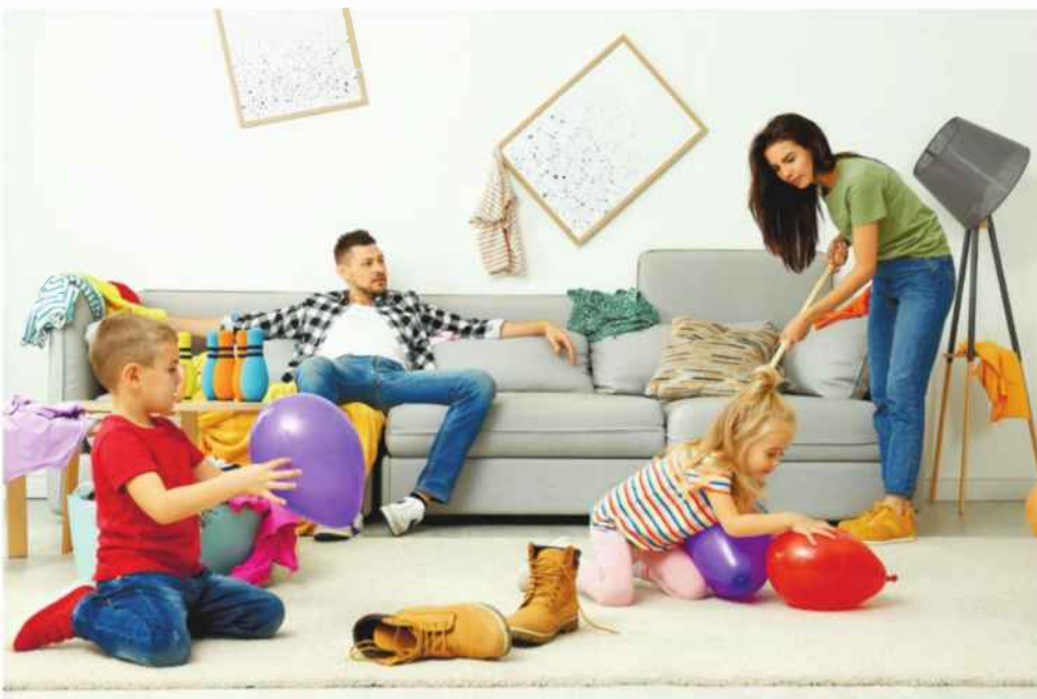
"הבעיה היא שאבות בישראל לא נוטלים אחריות על גידול הילד שלהם"

"הבעיה", ניסח זאת בהכרח ללה פקיד בכיר בממשלה, "היא שהאבות בישראל לא נוטלים אחריות על גידול הילד שלהם. הם חושבים שתפקידם לעזור לאבא בטיפול בילד, במקום להבין שגם הם ההורים שלו – והם צריכים לקחת חלק בגידול שלו בתור אבות, ולא בתור עוזרי אימהות". בפועל, גברים בישראל מתפקדים כקדים כאבות פגומים. אם למישהו נרמה שזה לא עניינה של המדינה – ובטח שלא העסק של משרד האוצר וראש הממשלה – שהוציא על כך דו"ח ארוך ב-2019, שיחשוב שוב. זאת, מאחר שהדו"ח של הצוות הבין-משרדי מצא כי הפגמים בתפקודו של הגבר הישראלי פוגעים בו, פוגעים בהתפתחות הילדים – וכמובן פוגעים במעמד האישה ובשכרה.